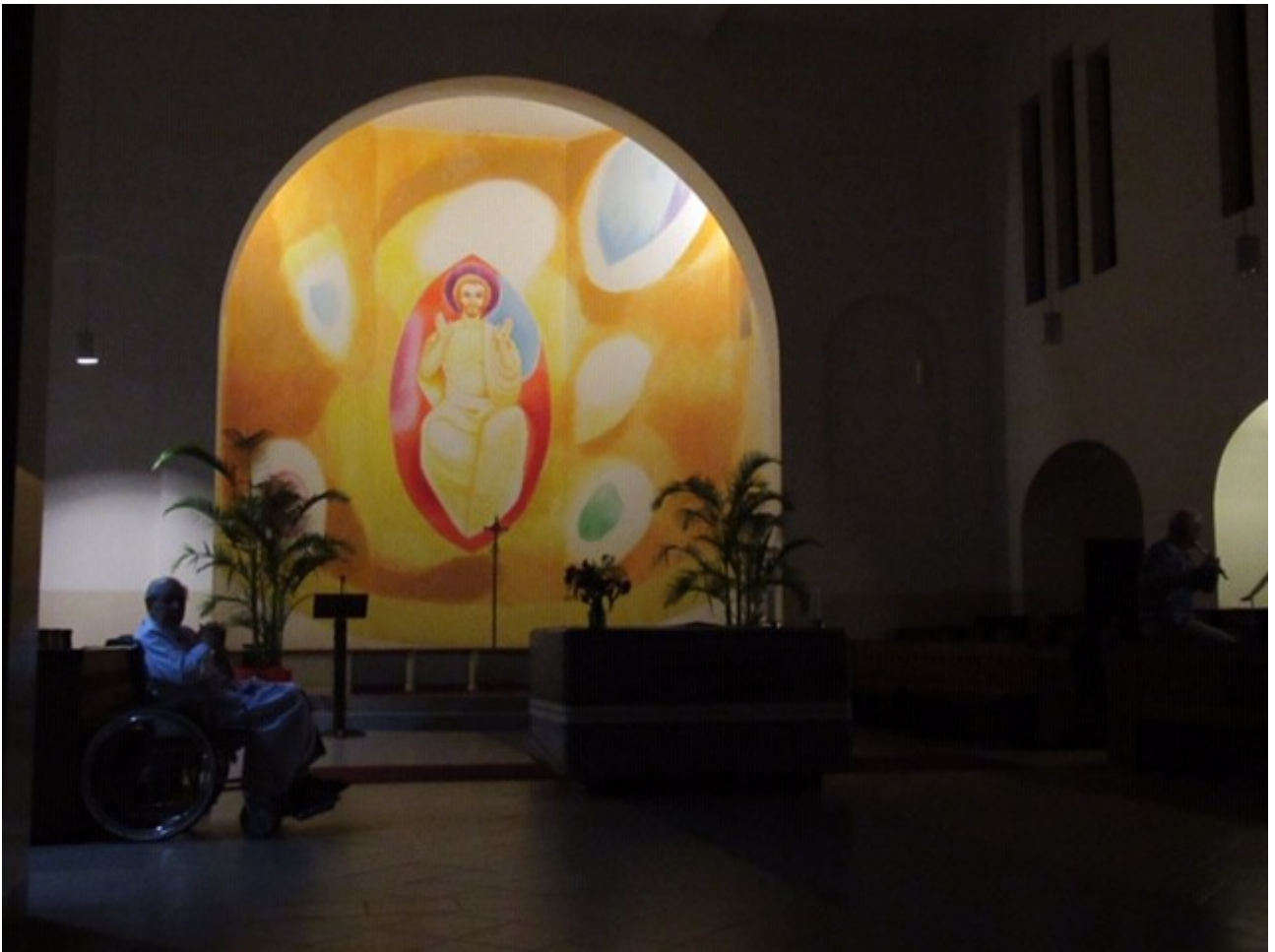
Soeren Gatz und Otilie Ecke