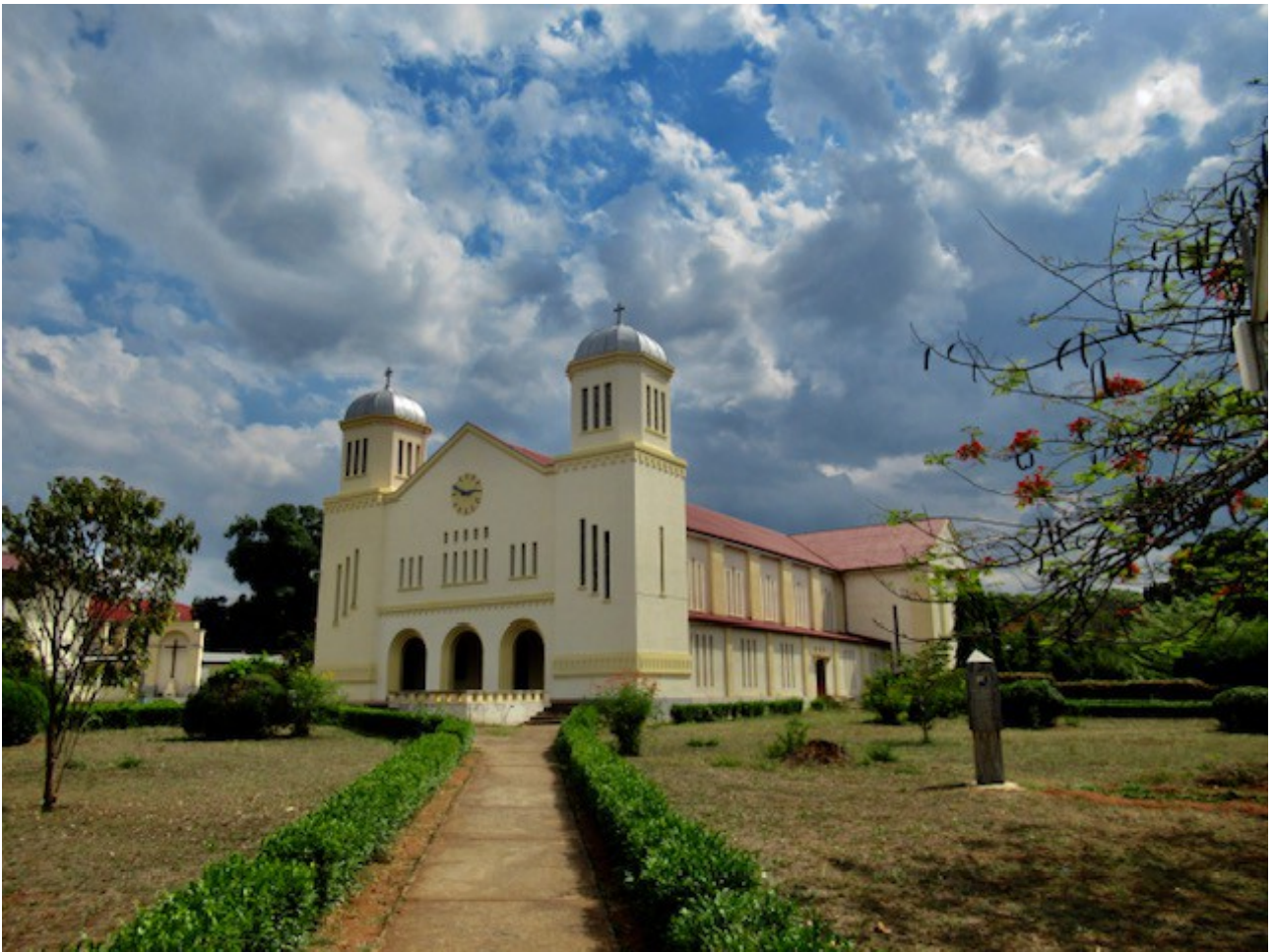
Klosterkirche im Zentrum