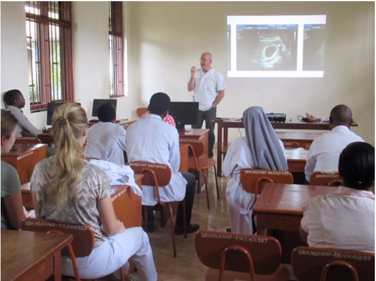
Seminare, manchmal zwei/d